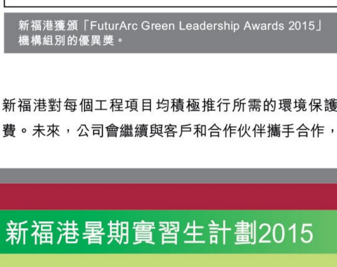
新福港獲頒「FuturArc Green Leadership Awards 2015」機構組別的優異獎。

「FuturArc Green Leadership Awards 2015」是由「FuturArc Journal」舉辦，旨在表揚綠色建築、以及具備創新理念和傑出環保管理的工程團隊，包括其發展商、顧問公司及承建商。這個獎項的評審小組成員分別來自印度、馬來西亞、新加坡、澳洲和香港等地的教授和領袖，以嚴謹態度、專業地選出亞洲區內的優秀綠色項目。