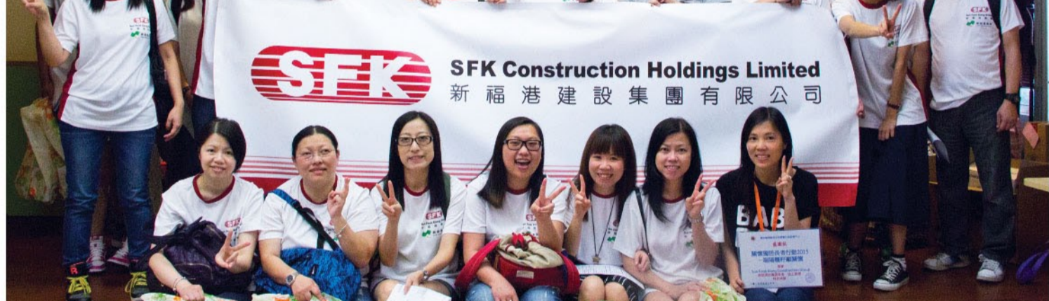
新福港和港鐵公司的義工團隊與仁濟醫院李陳玉輝安老院的長者於探訪活動中一同合照。

由鄰舍輔導會舉辦的「端午節關懷探訪2015」以深水埗區內的獨居長者為主要對象。深水埗區內現有超過五千名獨居及雙老同住的長者，他們大都只得到薄弱的支援網絡。新福港是次共派出約40名義工參與這項活動，上門探訪及致送應節禮物，親身向長者表達關懷，協助中心了解長者的需要，亦藉此增加體弱長者與外界接觸的機會。