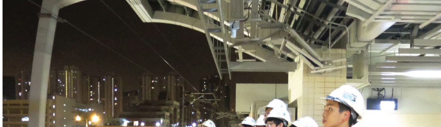
暑期實習生們在導師帶領下到港鐵馬鞍山綫改善工程項目的其中三個地盤進行工地考察。

新福港舉辦暑期實習生計劃的目的是栽培一群優秀並有意加入建造業的學生，透過給予他們實際的工作機會，從而更清楚建造業的運作。暑期實習生於實習期間會被分派到不同的部門或工地工作，並在導師的引導下，深入地了解不同崗位的職責和工作性質。