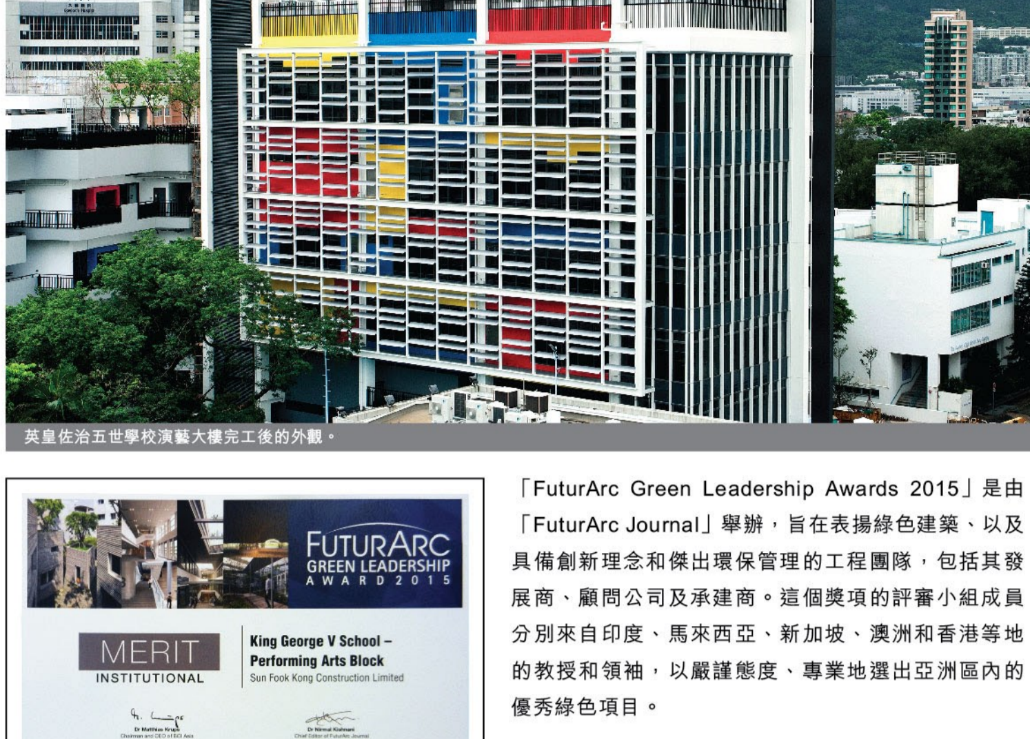
英皇佐治五世學校演藝大樓完工後的外觀。

由新福港負責承建的英皇佐治五世學校演藝大樓項目於本年度的「FuturArc Green Leadership Awards」中獲頒機構組別的優異獎。這項亞洲建築行業內權威的獎項不僅肯定了新福港的環保表現，亦反映出公司的工程質素備受外界認同。