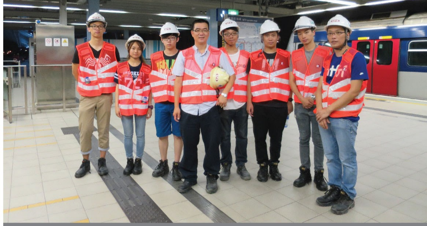
暑期實習生與導師於工地考察活動中合照。

未來，新福港會繼續舉辦暑期實習生培訓計劃，積極為社會培訓未來棟樑，鼓勵更多有潛質的青年人加入建造業發展，藉以為業界補充新力量。