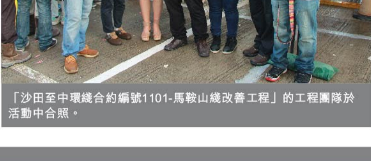
「沙田至中環綫合約編號1101-馬鞍山綫改善工程」的工程團隊於活動中合照。

新福港一直重視「品質」、「安全」和「環保」，同時會以關顧社區為目標，盡力照顧附近居民和行人的感受，努力打造高效工程。