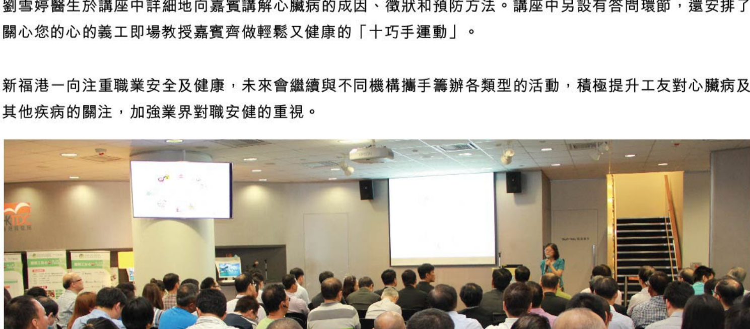
活動得到業界踴躍支持，共有超過150名來自不同建築公司的管理層和工友參與。

新福港一向注重職業安全及健康，未來會繼續與不同機構攜手籌辦各類型的活動，積極提升工友對心臟病及其他疾病的關注，加強業界對職安健的重視。