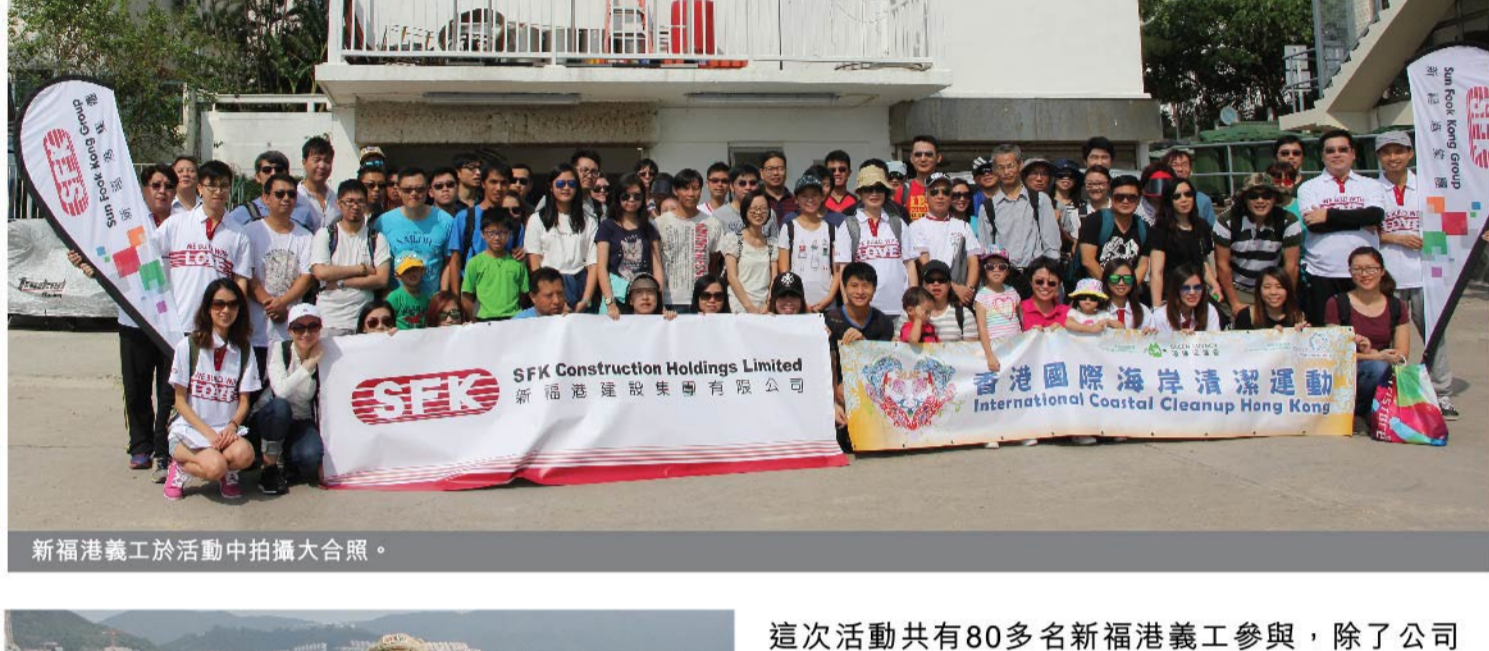
新福港義工於活動中拍攝大合照。

新福港於2015年10月18日與環保促進局合辦「香港國際海岸清潔籌款運動2015」，積極提高員工對海岸清潔的意識，為清潔海灘出一分力，彰顯企業社會責任和對香港海洋環境的關注。