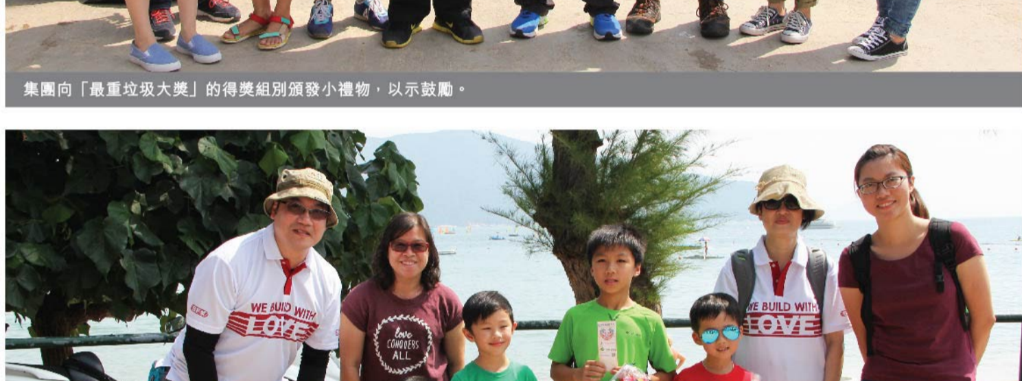
除了成人義工外，還有不少小朋友義工參與這次活動。