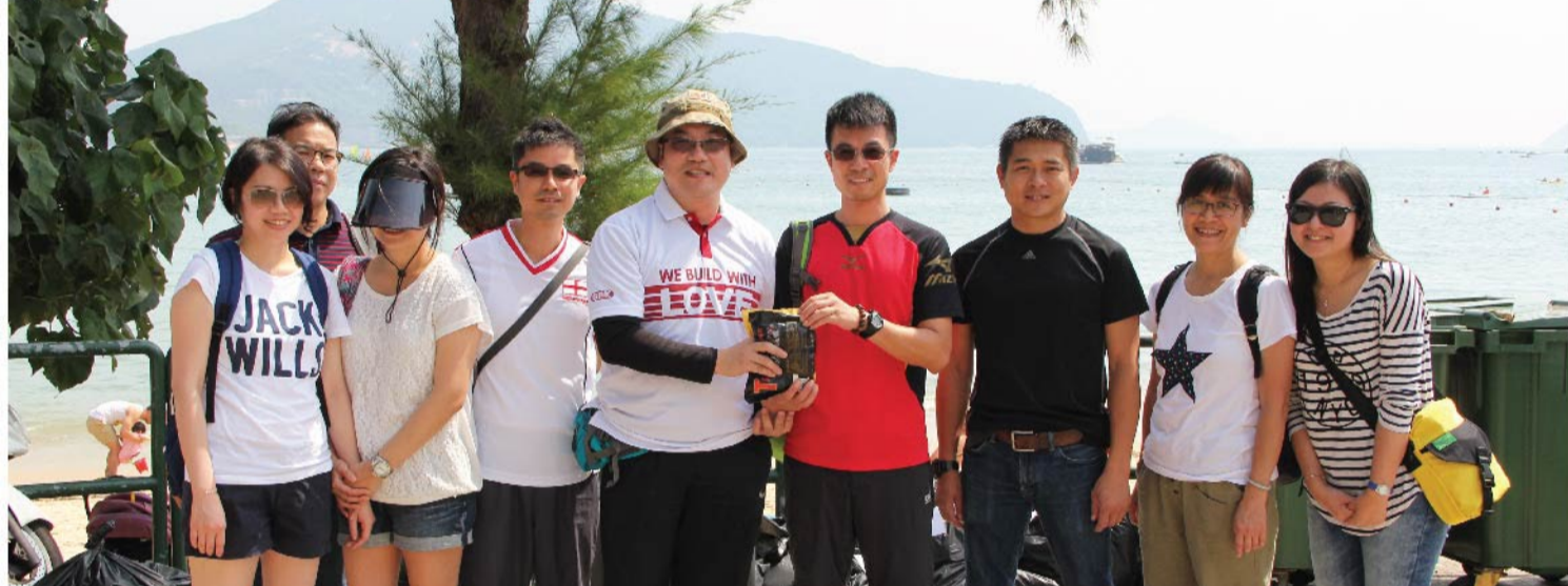
集團向「最重垃圾大獎」的得獎組別頒發小禮物，以示鼓勵。

新福港於未來會繼續舉辦類似的活動，積極提升員工和合作夥伴的環保意識，與各界攜手美化海岸環境、建造綠色生活。