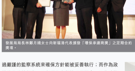
發展局局長林鄭月娥女士向新福港代表頒發「環保承建商獎」之定期合約獎項。

新福港在定期合約的組別中獲建築署頒發「環保承建商獎」，以表揚香港島西區、南區及大嶼山之定期保養合約，及屯門及元朗區之定期保養合約於環保方面的優秀表現。新福港營造有限公司自2010年4月起承接該兩項合約，主要為建築署負責保養的政府物業及社區設施，提供改建、加建、樓宇勘察、保養及維修服務。