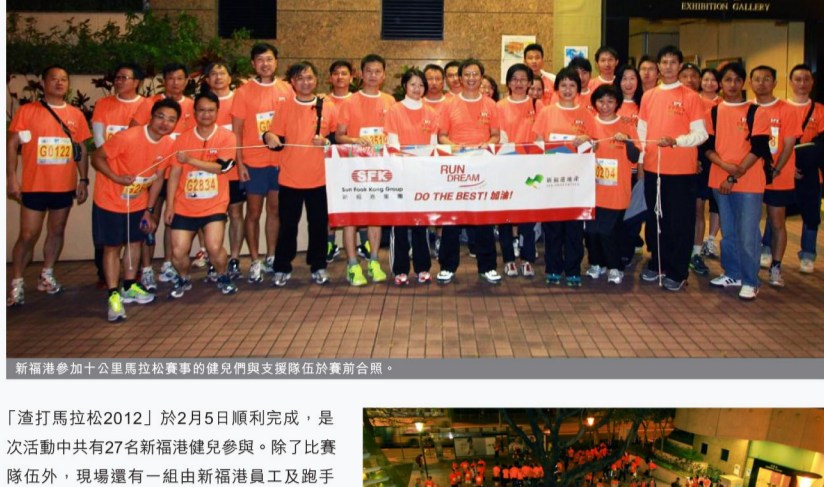
新福港參加十公里馬拉松賽事的健兒們與支援隊伍於賽前合照。

為了鼓勵員工多做運動，同時為慈善團體籌款，新福港集團於本年度首次組隊參與由渣打銀行(香港)有限公司及香港業餘田徑總會合辦的「渣打馬拉松2012」十公里賽事，並以「Run, Dream, We Build the Best!」為隊伍口號，推動共融精神，傳遞積極態度的信息。