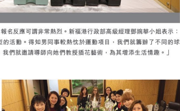
同學們與導師於完成作品後一起合照。

小原流花道為日本三大主流花道之一。有別於坊間尋常的花藝，小原流花道是一種以色彩美為中心，並結合了季節美和形態美的花材造型藝術。它提倡天、地、人之間的統一和諧，注重人與自然的共生，蘊含著深厚的文化哲理。