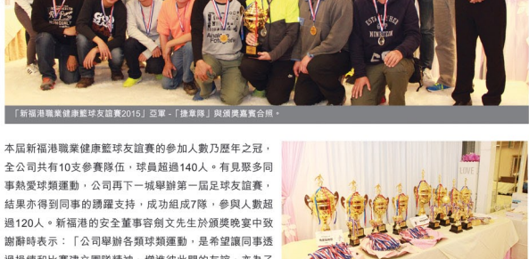
「新福港職業健康籃球友誼賽2015」亞軍-「捷章隊」與頒獎嘉賓合照。

本屆新福港職業健康籃球友誼賽的參加人數乃歷年之冠，全公司共有10支參賽隊伍，球員超過140人。有見眾多同事熱愛球類運動，公司再下一城舉辦第一屆足球友誼賽，結果亦得到同事的踴躍支持，成功組成7隊，參與人數超過120人。新福港的安全董事容文先生於頒獎晚宴中致謝辭時表示：「公司舉辦各類球類運動，是希望讓同事透過操練和比賽建立團隊精神、增進彼此間的友誼，亦為了推動同事多做運動，提升公司內部的運動文化。」