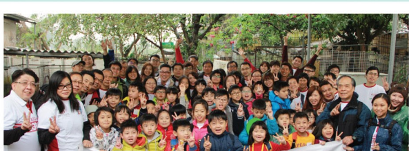
新福港義工與小朋友們於「親親大自然之旅2016」活動中合照。

為了宣揚綠色訊息及加強兒童對保護生態環境的意識，新福港於2016年3月13日與東華三院單車生態旅遊社會企業合辦「親親大自然之旅2016」，由新福港義工和東華三院的導賞員一同帶領40多名來自天水圍基層家庭的小朋友參觀元朗南生園敬輝農場，透過不同的活動加深對大自然生態的認識和了解。