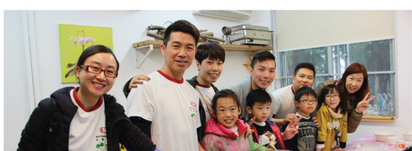
小朋友和新福港義工在活動中一同製作雞屎藤茶糕。

作為一個良好的企業公民，新福港一直致力支持各類社區活動及計劃，熱心貢獻社會。未來，公司會繼續鼓勵員工多參與社會服務，並舉行更多綠色活動，努力造福社群。