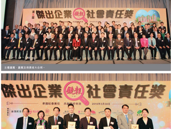
主禮嘉賓、嘉賓及得獎者大合照。

新福港集團連續五年獲《鏡報》月刊頒發「傑出企業社會責任獎」，再次肯定集團於履行社會責任方面的努力。是次頒獎典禮於本年度3月30日在九龍尖沙咀唯港薈酒店宴會廳舉行，並邀得香港特別行政區行政長官梁振英先生擔任主禮嘉賓。