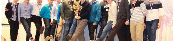
「新福港職業健康足球友誼賽2015」亞軍-「保潔隊」與頒獎嘉賓合照。