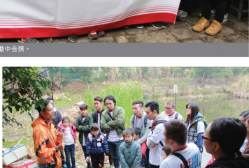
小朋友在新福港義工和東華三院生態導賞員的帶領下認識及親身體驗農耕工序。

新福港共有50名義工參與是次活動。一眾義工和小朋友在導賞員的帶領下參觀及認識農場內的動植物，並親身體驗包括開地、翻土、移苗、澆水、施肥和防蟲害等農耕工序，還一起即場製作和品嚐雞屎藤茶糕，彼此樂融融融，渡過了非常愉快和充實的一天。