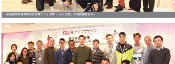
「新福港職業健康籃球友誼賽2015」冠軍-「迪士尼隊」與頒獎嘉賓合照。

新福港於2016年3月11日為「新福港職業健康籃球友誼賽2015」及「新福港職業健康足球友誼賽2015」舉辦頒獎晚宴。經過多場激烈賽事，「新福港職業健康籃球友誼賽2015」的冠軍最終由「迪士尼隊」奪得；而「新福港職業健康足球友誼賽2015」的冠軍則由「機場及精英聯隊」奪得。